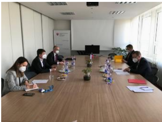
Predstavitelia PMÚ SR a ÚOHS počas pracovnej návštevy, 02. 02. 2022, Bratislava

V rámci ďalšieho rozvíjania bilaterálnej spolupráce s partnerským úradom na ochranu hospodárskej súťaže v Českej republike (ďalej len „ÚOHS“) predstavitelia PMÚ SR dňa 2. 2. 2022 privítali hostí z ÚOHS na pracovnej návšteve v Bratislave. Pre obe strany bola pracovná návšteva príležitosťou na podrobné prekonzultovanie viacerých aktuálnych výziev , ktorým v súčasnosti čelia obe inštitúcie a zároveň na zaujatie jednotného a čo najlepšieho postoja k riešeniu momentálnych otázok pri ochrane hospodárskej súťaže a presadzovaní jej princípov.