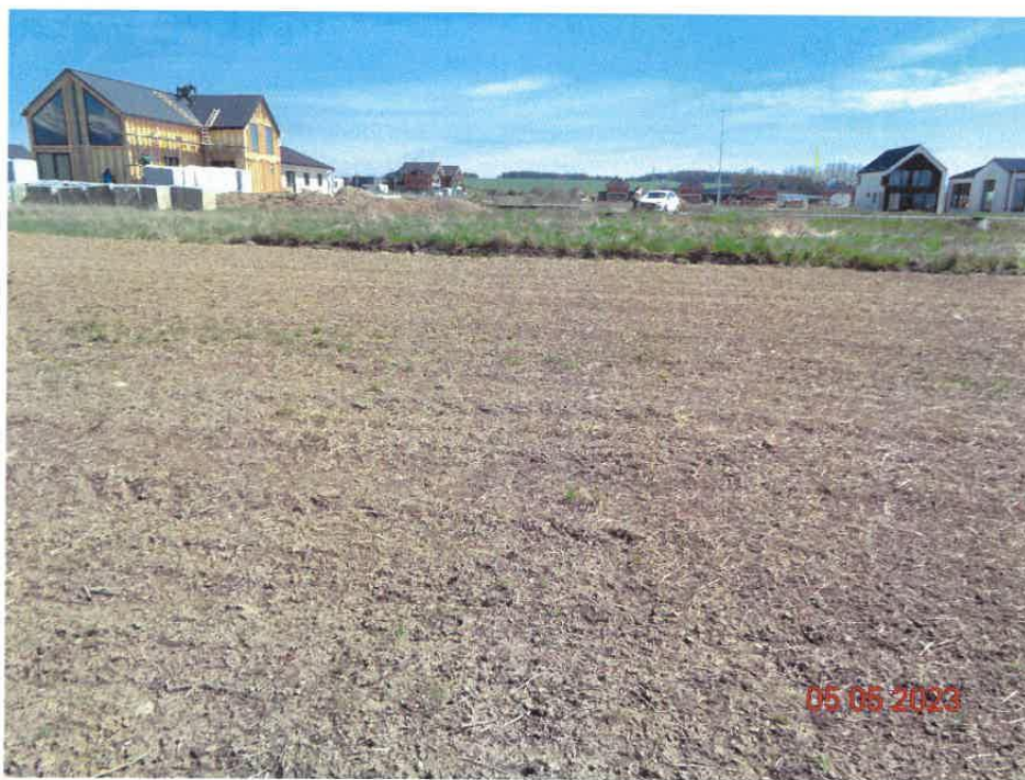
pohľad z parc. č. 3855 na susediacu výstavbu nových rodinných domov