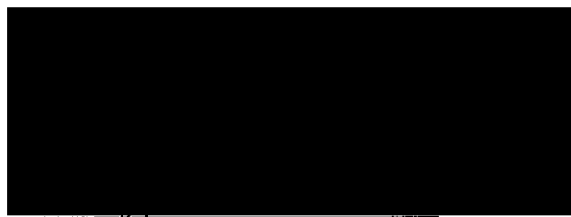
zhotoviteľ Ing. arch. Ján Katusčák