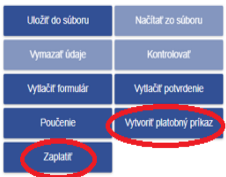
Obrázok č. 2