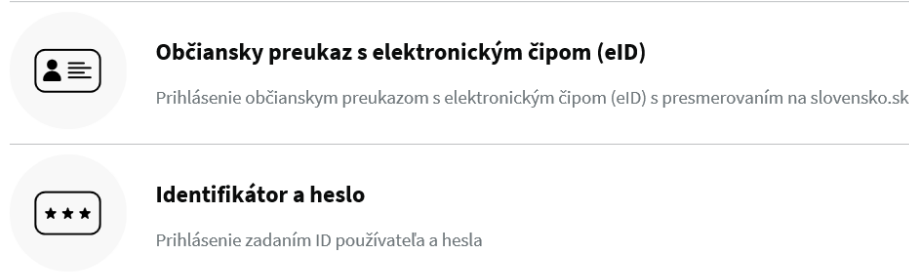
Obrázok č. 1 – Spôsob prihlásenia