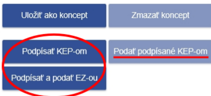
Obrázok č. 8 – Možnosti podpísania a podania elektronického formulára

6) Po kontrole formulára podnikateľ „Oznámenie o ukončení používania pokladnice e-kasa klient“ podpíše a podá EZ-ou (elektronickou značkou), táto možnosť sa týka podnikateľov, ktorí majú s daňovým úradom podpísanú dohodu o elektronickom doručovaní alebo podpíše KEP-om, týka sa podnikateľov, ktorí používajú kvalifikovaný elektronický podpis alebo eID kartu. Podnikateľ, ktorý používa KEP musí ešte kliknúť na Podat' podpísané KEP-om a následne sa zobrazí informácia, že oznámenie bolo odoslané.