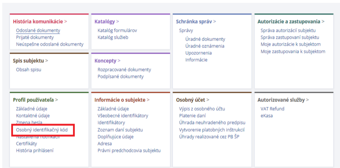
Obr.3 – OIZ – Profil používateľa – Osobný identifikačný kód

OIK nie je prihlasovacie 7 miestne ID, ale kód zadaný používateľom v registračnom formulári. Každý registrovaný používateľ si môže svoj OIK preveriť po prihlásení do svojho vlastného používateľského účtu na PFS v časti Profil používateľa - Osobný identifikačný kód.